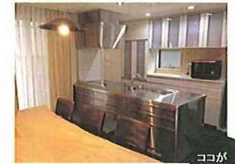
機能的なキッチンスペース!!

それぞれの部屋には、考え抜かれた使いやすい収納があります。またホールの吹き抜けの開放感をご体感ください!! ◎木造2階建、延床182.55㎡の建物となります。